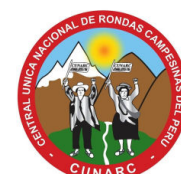
Central Única Nacional de Rondas Campesinas del Perú (CUNARC-P)