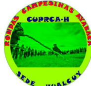
Central Única Provincial de Rondas Campesinas de Ayabaca-Hualcuy