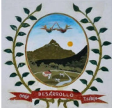
Comunidad Campesina "Segunda y Cajas"