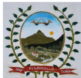
Comunidad Campesina "Segunda y Cajas"