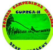
Central Única Provincial de Rondas Campesinas de Ayabaca-Hualcuy