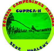
Central Única Provincial de Rondas Campesinas de Ayabaca-Hualcuy