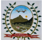
Comunidad Campesina "Segunda y Cajas"