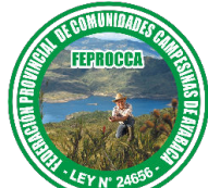
Federación Provincial de Comunidades Campesinas de Ayabaca

Central Única Provincial de Rondas Campesinas de Huancabamba