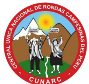
Central Única Nacional de Rondas Campesinas del Perú (CUNARC-P)