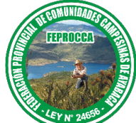
Federación Provincial de Comunidades Campesinas de Ayabaca

Central Única Provincial de Rondas Campesinas de Huancabamba