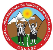
Central Única Nacional de Rondas Campesinas del Perú (CUNARC-P)