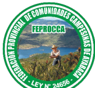
Federación Provincial de Comunidades Campesinas de Ayabaca

Central Única Provincial de Rondas Campesinas de Huancabamba